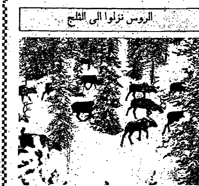
الروس نزلوا الى الثلج

موجة الصبح تسم العالم ، والرؤوس الذين خرجوا هذا الشتاء ، ويعلمون بالاضواء الضعيف ، تركوا اذن البرادة ، ونزلوا الى الكاهن اللطيفة برفقة مجموعة من الابل يتلون فيها اشعار ، في القابل ، مجموعة ثالثة فالتج على الثلج ، وتزرع غايات السود والشرين جثة ودهانها .